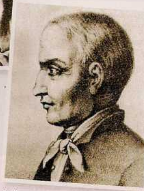
Kőrösi Csoma Sándor